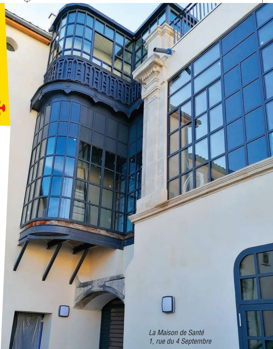
La Maison de Santé 1, rue du 4 Septembre