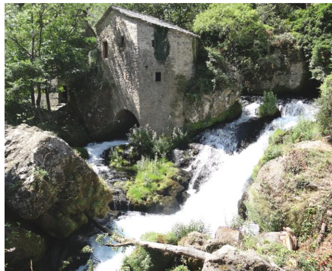
Les moulins de la Foux

La mise en œuvre de la seconde phase de l'Opération Grand Site en 2012 permet