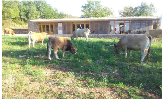
Les belvédères de Blandas (Gard)

250 000 visiteurs annuels profitent des vues très impressionnantes du Cirque de Navacelles depuis les belvédères de la Baume Auriol et de Blandas, et des éléments patrimoniaux remarquables sur les causses.