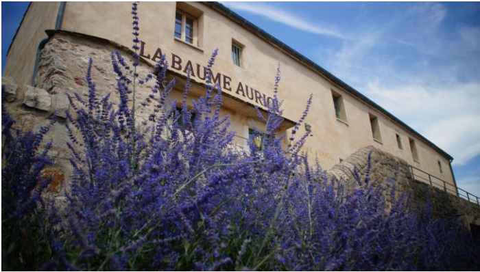
Le belvédère de la Baume Auriol (Hérault)