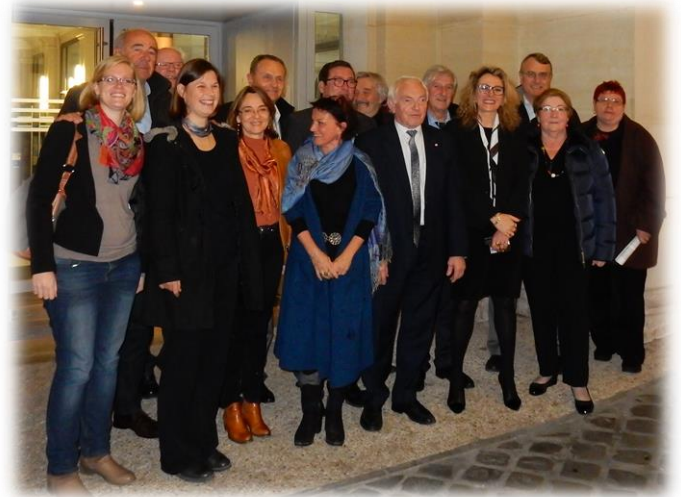
Une équipe soudée ! Délégation présente à la commission Supérieure des Sites le 16 décembre 2016

3- Contribuer activement à faire reconnaître la valeur patrimoniale des paysages agropastoraux au sein du Bien Causses & Cévennes, inscrit sur la liste du patrimoine mondial de l'humanité de l'UNESCO.